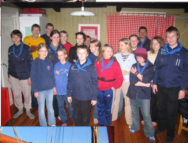
Kololla, helmikuu 2004