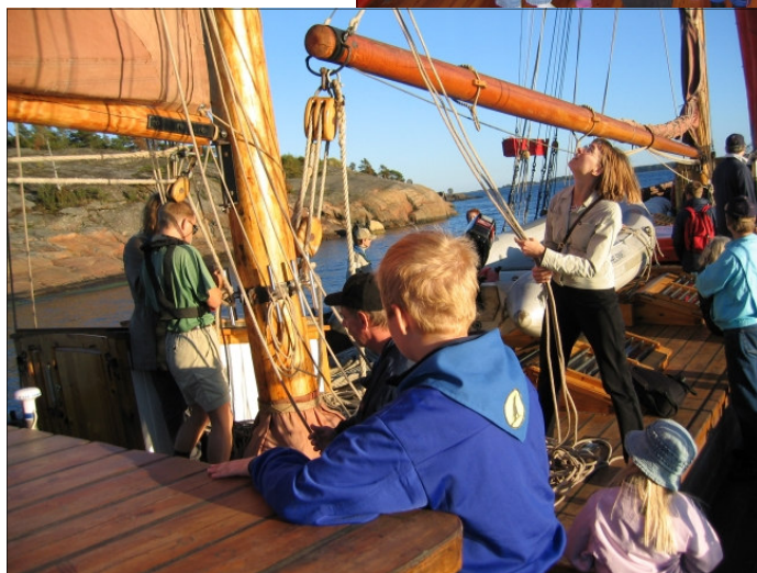
Valborg- purjehdus, 2003