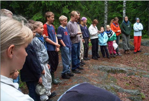
MES:n kesäleiri 2003, lipunnosto