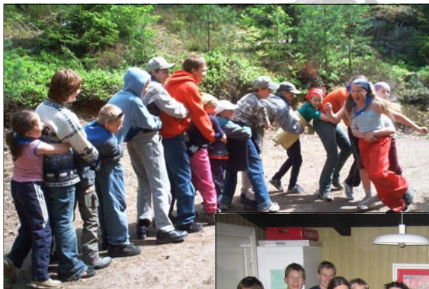
Kesäleiri 2003, Nuuksio