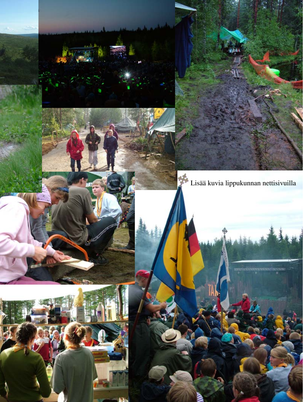
Lisää kuvia lippukunnan nettisivuilla