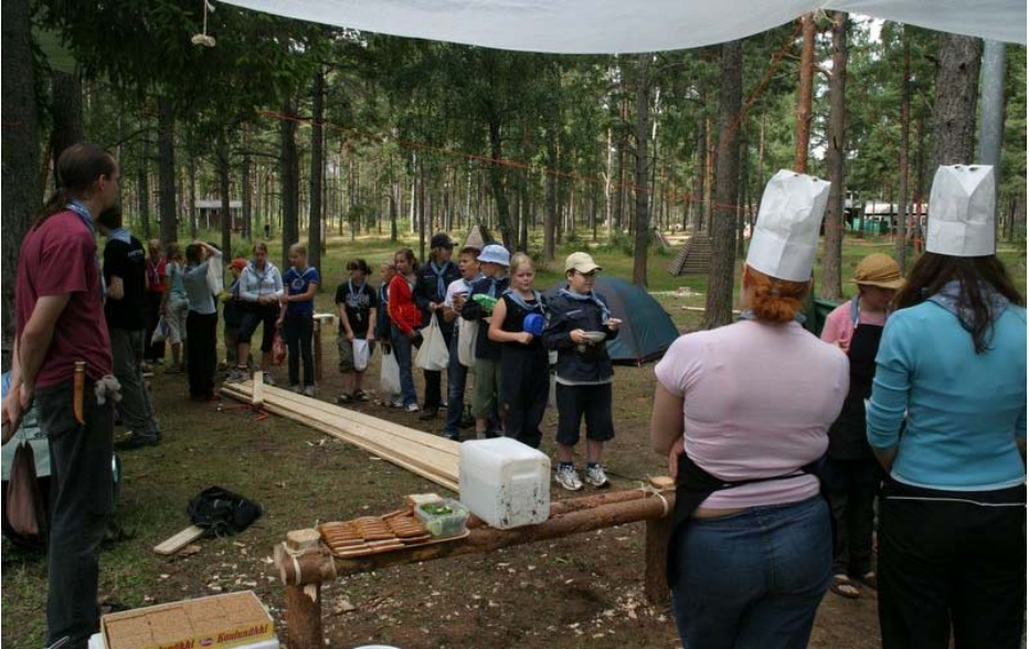
Ruokailun aikaan savumme keittiön eteen muodostui aina piihtä jono.

samana päivänä, lähdin itse aamuvarhaisella hakemaan heitä Leppävaarasta. Vierailupäivänä 6.8 leiriin saapui vanhempia ja tuttavuuksia, ja leirialueella järjestettiin markkinat. Savullamme oli miekkailuareena savun portin ulkopuolella. Illalla oli luvassa yllätysohjelmaa, kun pysäytettiin parkkipaikkahanketta joukkovoimalla. Iskulauseet tulivat tutuiksi ja tapahtuman kohokohta oli varmasti kun tiukististi Ritva Harakka nousi lavalle tanssiin ja jokaiselle jaettiin popcornit.