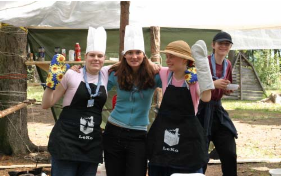
Toimitus kiittää kaikkien leiriläisten puolesta keittiöhenkilökuntaa maistuvista ruuista!

Vartiolaiset lähtivät haikille 4.8, valittavasti satoi melkein koko haikin ajan. Sudenpennut saapuivat leiriin