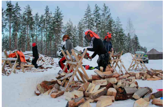
Polttopuuta leirillä kului hyvin paljon.