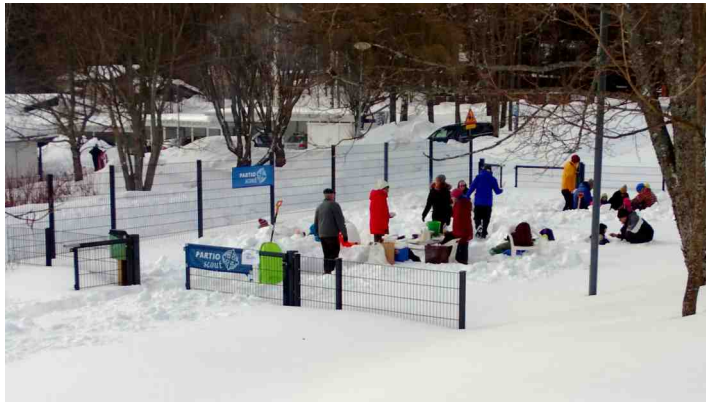
Eräsusien letunpaistopisteellä riitti kävijöitä.