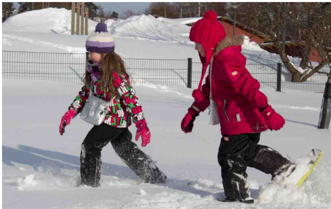
Myös lumikenkäily oli suosittu aktiviteetti.