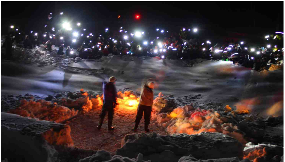
Yhteisissä ohjelmissa oli tunnelmaa.

Sunnuntaina olikin jo aika pakata tavarat ja suunnata kohti kotia. Melkein kaikkien mielestä leiri oli liian lyhyt, mutta muuten erittäin onnistunut ja ihana kokemus. Jotkut väittivät leirin olleen jopa Sarastetta parempi, mikä on jo kova saavutus – mutta hyvin mahdollista. Ensi talvena järjestetään espoolaisten oma talvileiri Vinkuli yli 12-vuotiaille. Toivottavasti siellä nähdään paljon eräsusia!