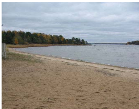
Leirialueella Syndalenissa on mahtava hiekkaranta!

Väiski-yhteyshenkilö Antti Puh. 040-7083120