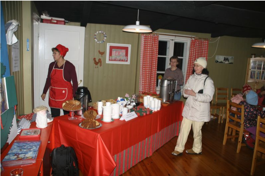
Adventtitapahtuman bufettipöytä täynnä herkuja