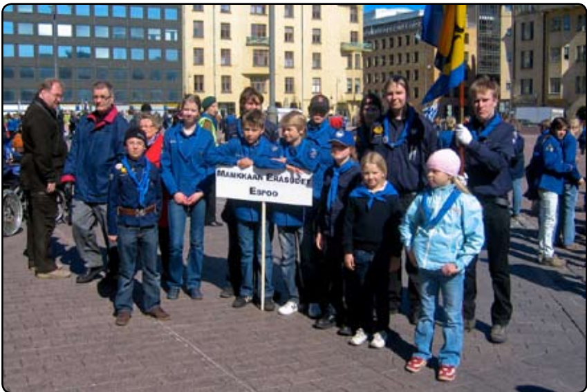
Eräsusien edustus partioparaatissa 22.4. Paikalla oli 12 Eräsutta, toivottavasti ensi kerralla enemmän!

Ps. Otamme syksyllä uusia jäseniä, joten kannattaa jo vinkata kaverille..