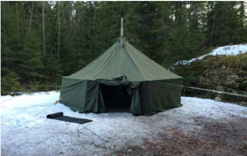
▲ Telтта saatiin pystytettyä pitkän urakan tuloksena.