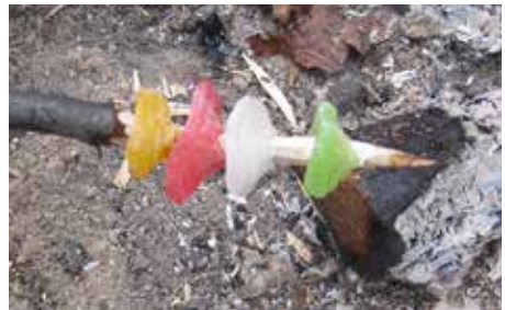
▲ Karkit paistuivat hyvin nuotiolla.

peasti. Rakensimme ruokailupussitelineen, joka piti heti purkaa (koska riuku olikin toisten partiolaisten rastehtävää varten). Keksimme myös itse hyvää ohjelmaa: karkkien grillausta nuotiolla. Olimme tekemässä lounasta, kun saaremmen valloitettiin: paikalle tuli yli kymmenen henkilöä, partiolaisia ja ulkomaalaisia turisteja. Halusimme rauhaa, joten lähdimme pitkälle vaellukselle (noin 200 metriä) puulaavulle. Emme voineet heti majoittautua, koska joku tyyppi nukui siellä. (Olimme kysyneet aiemmin, milloin he lähtevät.)