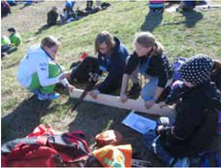
▲ Kätevyystehtävänä kisan lähdössä oli linnunpöntön rakentaminen. ►