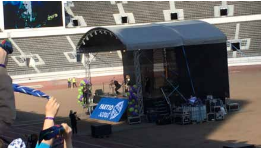
▲ Tapahtuman musiikista vastasi vuoden live-esiintyjänä palkittu Haloo Helsinki!