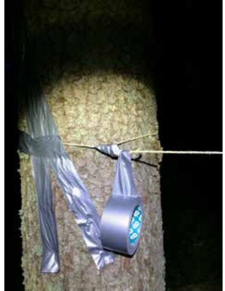
▲ Ilmastointiteipille löytyi mielenkiintoisia käyttötapoja. ▲