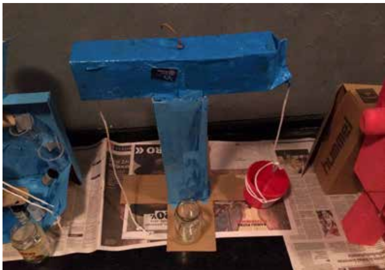
▲ Piippoleväkotioiden rakentama nosturi