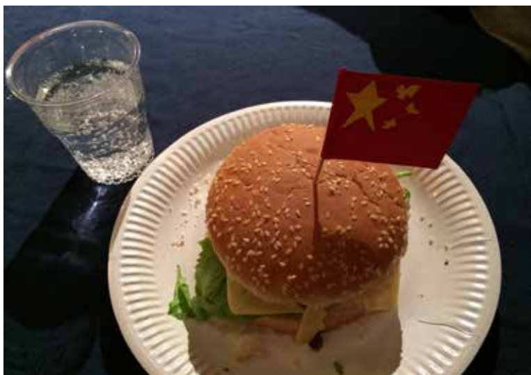
▲ Päivän lounasta koristi Kiinan lippu.