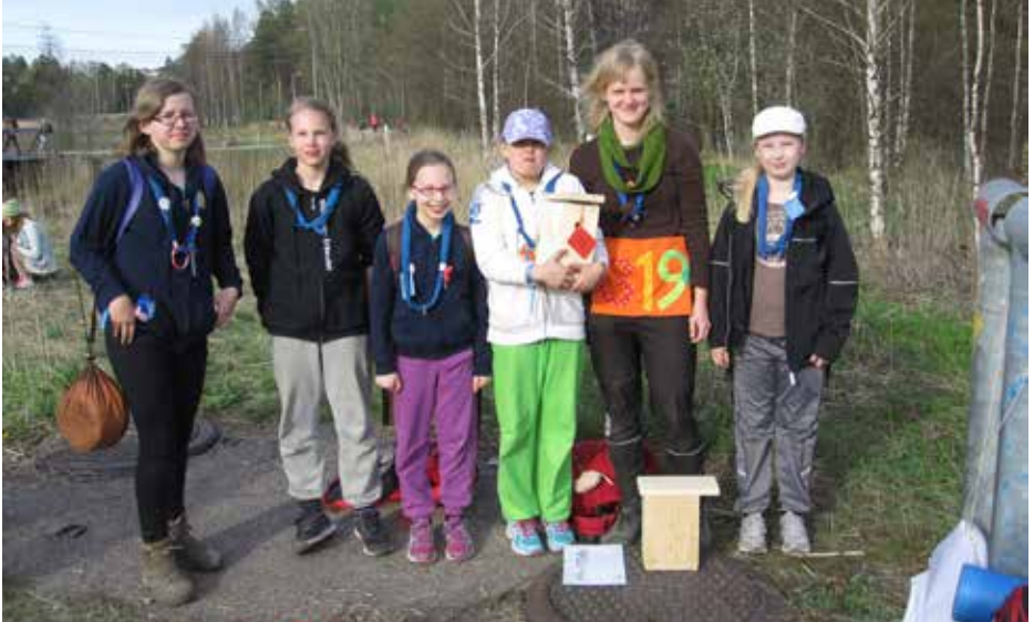
▲ Pöllönpoikaset ylpeänä maalissa